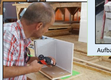
Bau des 1:1-Modelles (Modul 11)