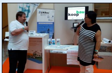
„Tag der off. Tür“ der Bundesregierung