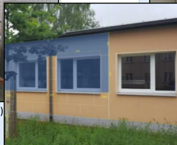
digitales Fassadenaufmaß (Modul 10)