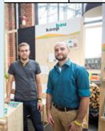
Zukunftswerkstatt Berlin, Sept. 2016