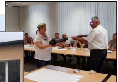
Technikinput (Modul 12)