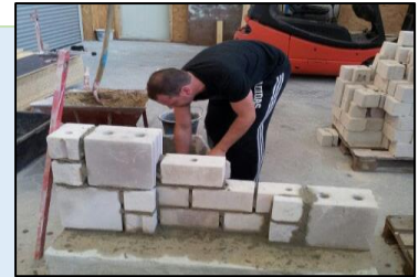
Aufbau Versuchswand (Modul 11)